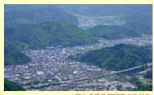
山頂から見た郡留市の街並み